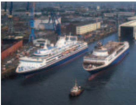
Links am Ausrüstungskai die „OLYMPIA VOYAGER“. Die „OLYMPIA EXPLORER“ verlässt das überdachte Baudock

Die „OLYMPIA VOYAGER“ und ihr Schwesterschiff „OLYMPIA EXPLORER“ setzen die Tradition ein-drucksvoller Passagierschiffe mit dem Gütesiegel – gebaut bei Blohm + Voss – fort. Mit der „Fast-Monohull-Technologie“ wurden zwei Kreuzfahrtschiffe gebaut, die aufgrund ihrer Geschwindigkeit und ihrer Ausstattung bereits kurz nach ihrer Ablieferung 2000 bzw. 2002 von international renommierten Fachjuries mit Preisen ausgezeichnet wurden.