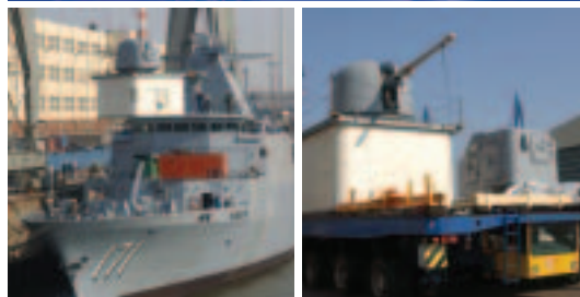
Das modulare Entwurfskonzept von Blohm + Voss macht den Bau und den Unterhalt von Marineschiffen wirtschaftlich

Die Anforderungen an moderne Marineschiffe haben sich grundlegend geändert. Die Aufgabenbereiche reichen vom Schutz der 200-Meilen-Zone über Zoll/Polizei- und SAR-Aufgaben bis hin zu klassischen Verteidigungsaufgaben. Die Lösung für diese vielfältigen Aufgaben bietet Blohm + Voss mit seinem in den 70er-Jahren entwickelten und seither stetig gemäß den neuesten nationalen und internationalen Anforderungen optimierten MEKO®-Modular-Konzept. MEKO® steht für Mehrzweck-Kombination.