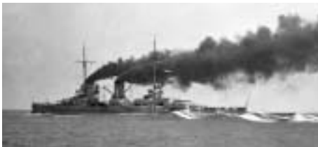
Der Schlachtkreuzer „GOEBEN“ stand bis 1950 im Dienst der türkischen Marine

Die Erfahrung mit über 500 gebauten Marineschiffen in den vergangenen 110 Jahren bildet die Basis, um auch im 21. Jahrhundert auf diesem anspruchsvollen Gebiet weiterhin erfolgreich zu sein.