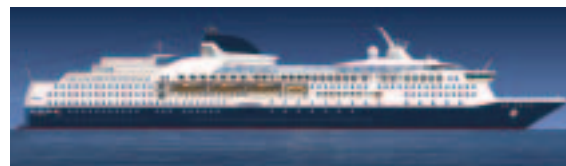
FM 175: 205 m schnelle Eleganz