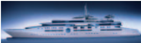
Projekt M-147: eine Projektstudie für eine 147m lange MEGA-Yacht

Fortgeführt wird diese eindrucksvolle Serie mit dem neuesten Yachtdesign. Die „M-147“ ist eine ultra-moderne MEGA-Yacht des Designers Hermidas Atabeyki, die in den Bereichen „Design“ und „Ausstattung“ zu den modernsten und innovativsten der heutigen Zeit gehört.