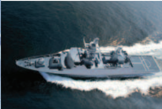
Animation der neuen Korvette der Klasse 130 für die Deutsche Marine

Als Generalunternehmer für die Fregatten der Klasse 123 und der Klasse 124 konstruiert und baut Blohm + Voss - in Arbeitsgemeinschaften mit der Howaldtwerke-Deutsche Werft AG (HDW) und der Nordseewerke GmbH (NSWE) - im Auftrag des Bundesamtes für Wehrtechnik und Beschaffung (BWB) die neuesten und größten Kampfschiffe der Deutschen Marine.