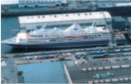
Die „OLYMPIA EXPLORER“ am Ausrüstungskai