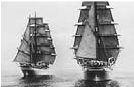
Die Segelschulschiffe „Horst Wessel“ (links) – heute unter dem Namen „EAGLE“ im Einsatz bei der US Coast Guard – und „GORCH FOCK I“

Vor rund 110 Jahren wurde von Blohm + Voss das erste Marineschiff abgeliefert: der kleine Kreuzer „SMS CONDOR“. In den folgenden Jahrzehnten sind Schiffe, die als Meilensteine in der Schiffbautechnik gelten, bei Blohm + Voss vom Stapel gelaufen. Dazu gehörten z.B. der Schlachtkreuzer „GOEBEN“ (abgeliefert 1911), der bis 1950 im aktiven Dienst der türkischen Flotte stand, der Schwere Kreuzer „ADMIRAL HIPPER“ (abgeliefert: 1939) und natürlich das berühmte Schlachtschiff „BISMARCK“ (abgeliefert: 1940). Aber auch große Segelschiffe liefen vom Stapel und befahren noch heute die sieben Weltmeere. Die „GORCH FOCK I“ - heute „TORWARISCHTSCH“ - wurde 1933 gebaut. Die „GORCH FOCK II“ - abgeliefert 1958 – gilt heute als das bekannteste Schiff der Deutschen Marine.