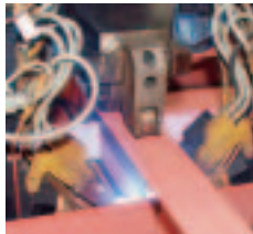
Fertigungsprozesse optimiert – im Schiffbau bei Blohm + Voss wird Schiffbaustahl mit Laser geschweißt und geschnitten

Die Basis für wirtschaftlichen, erfolgreichen Schiffbau sind modernste Fertigungstechniken. Auch hier nimmt die Blohm + Voss GmbH eine Spitzenstellung ein. Mit der im Jahr 2001 in Betrieb genommenen kombinierten Laserschweiß- und Schneidstraße ist es gelungen, die Fertigungsprozesse weiter zu optimieren und die Produktivität zu steigern.