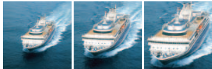
Passagierschiffe gestern und heute: oben die EUROPA (1930) und unten die „OLYMPIA VOYAGER“ (2000) während der Probefahrt

Mit der Entwicklung des "Fast-Monohull-Konzepts" hat Blohm + Voss ein weiteres Stück Schiffbaugeschichte geschrieben. Das neue Rumpfkonzzept ermöglicht bei vergleichsweise hohen Geschwindigkeiten (ca. 30 kn / ca. 56 km/h) eine Treibstoffeinsparung von bis zu 20% im Vergleich zu konventionellen Rumpfformen. Damit reagiert Blohm + Voss auf die wachsende Nachfrage nach schnellen Schiffen und bietet eine neue Qualität im Seetransport. Den Reedereien werden somit erhebliche Rationalisierungseffekte geboten.