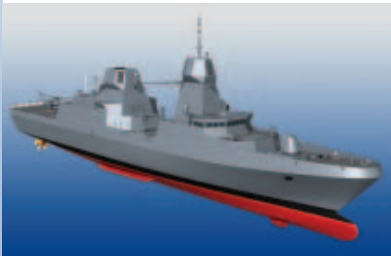
Computeranimation der MEKO® D.

Ein neues Mitglied in der MEKO®-Familie ist die „MEKO® D“. Vorgestellt wurde die neueste Entwicklung im Bereich der MEKO®-Technologie 2002 im Rahmen der internationalen MEKO®-Conference (MECON) in Hamburg. Die neue „MEKO® D“ ist für die unterschiedlichsten Aufgaben entwickelt. Die Ausstattung ist variabel und reicht von der Abwehr von Luftzielen (AAW) bis zur Abwehr von Überwasser- (ASW) und Unterwasserzielen (ASuW). Dieser Schiffstyp kann aber ebenso – aufgrund seiner umfangreichen Ausstattung im Bereich der OPZ – als Kommandoeinheit in internationalen Verbänden eingesetzt werden.