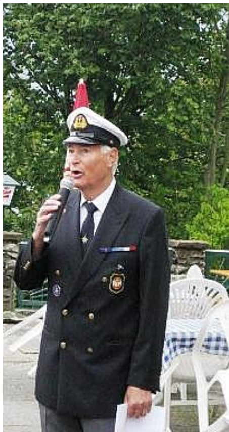
(Die Begrüßung des Vorsitzenden)

Es sollte ein großes Fest werden und es wurde ein großes Fest. Die Vorbereitungen waren umfangreich und begannen bereits im Vorjahr. Letztlich hat alles geklappt und es wurde ein Tag, der von allen, die gekommen waren, gelobt wurde.