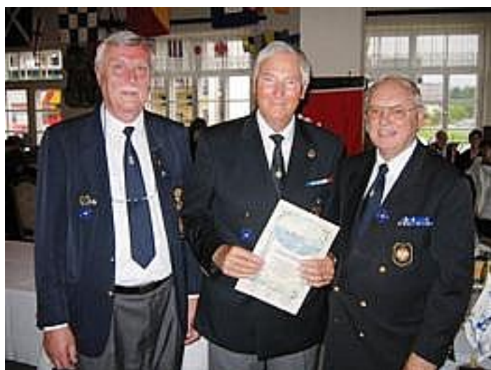
(Bei der Ehrenzeichenverleihung)

Eine besonders weite Anreise hatten Mitglieder der MKS: